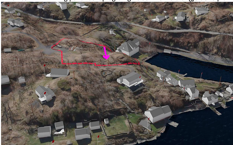
Planområdet på 3D modell. Pila viser aktuell plassering av fritidsbolig.

En landskapsvurdering (vedlagt) konkluderer med at hytta med denne plasseringen og utformingen, vil få liten innvirkning på landskap og omgivelser i forhold til gjeldene plan.