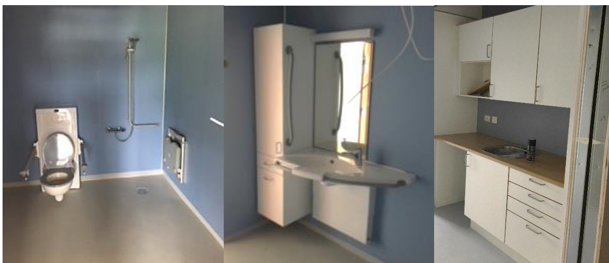
Bilder fra baderom og kjøkken i en av hyblene.